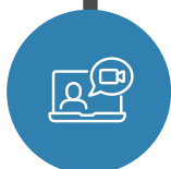
Figure professionali che vogliono acquisire competenze per operare in modo innovativo nel settore delle risorse umane. E' richiesto il possesso del Diploma di Laurea triennale o esperienza nella gestione risorse umane di almeno 2 anni.